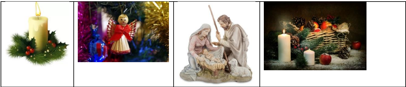
А) Новый год В) Благовещенье Б) Рождество Христово